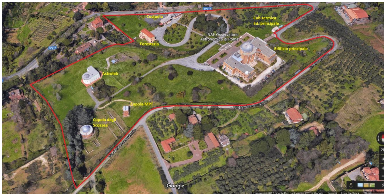
Figura 3 - Vista a volo d'uccello del comprensorio con l'indicazione dell'ubicazione dell'edificio principale.