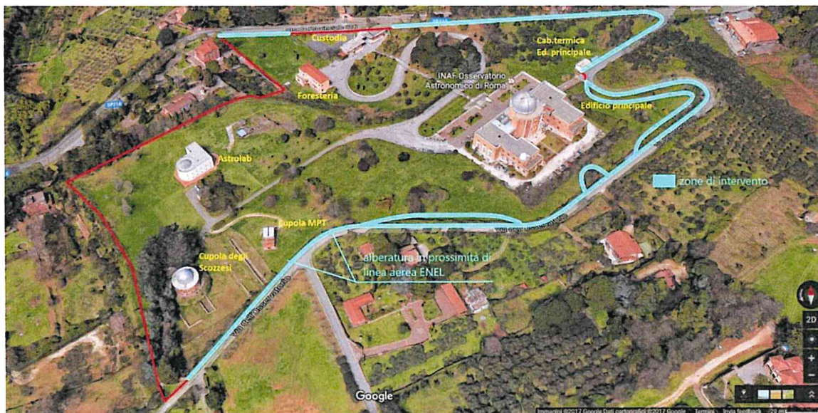
Figura 1 - Vista a volo d'uccello del comprensorio con indicate le zone di intervento