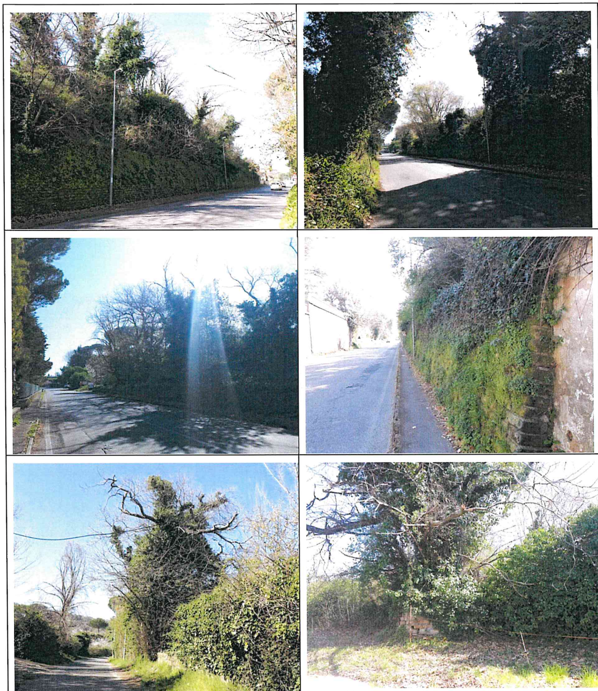
Monte Porzio Catone, li 1 aprile 2021