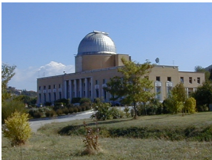
Figura 1 - edificio principale Osservatorio

Nel presente documento sono allegate le planimetrie dell'edificio e alcune fotografie illustrative, utili a individuare i principali luoghi di svolgimento delle attività. Le immagini hanno valore puramente indicativo.